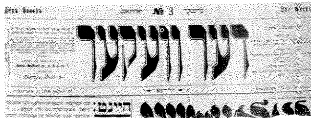
"דער וועקער" (המעורר) - כך נקראו ביטאונים לא מעטים של ה"בונד"

מן התוכן: חנוכה של פועלי המברשות (מס. 1). ציונות ואנטישמיות (מס. 2). הוועידה ה-8 שלנו (מס. 3) בעניין שבתות (מס. 4 ו-5). הוועידה ה-9 שלנו (מס. 6).