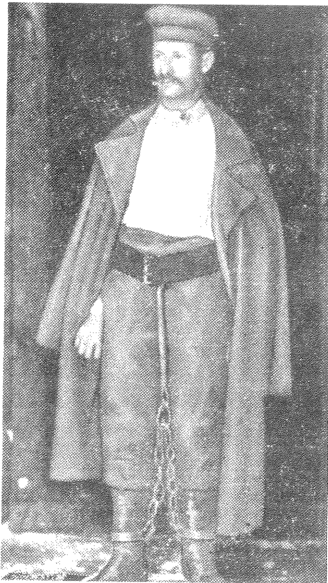
חבר "בונד" באזיקים - הסופר והמחזאי ה. ליוויק. הוא נדון ב'1906 לארבע שנות עבודות פרך בסיביר

מס. 1, 26 במאי, 4 עמ', 35.5 \times 22.5 ס"מ, 20 עותקים. משוכפל. "הקבוצה שהוציאה פירטום זה הצטרפה ל'בונד' והפרטום נפסק עם הגיליון השני" (ציון בכתב-יד ברוסית, בעמ' 4 של הגיליון, בארכיון ה"בונד". אינו מופיע אצל קירזניץ).