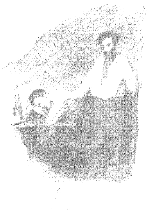
"הפועל היהודי" — מביטאוני המרכזיים של ה"בונד"

מס. 17, נובמבר 1904, 89 עמ' (+3). על השער מצויין בטעות, אוקטובר.